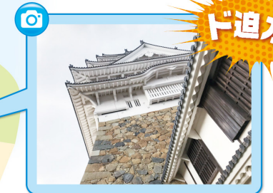
連なって見える天守の屋根瓦