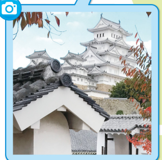
急な坂を登った先に…!!