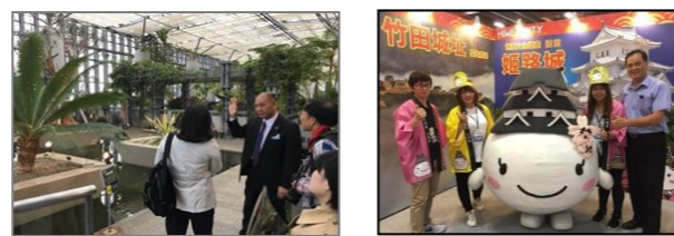
[ブローカー招請ツアー] [台湾・旅行博でのPR]