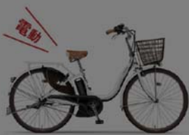
電動自転車26インチ