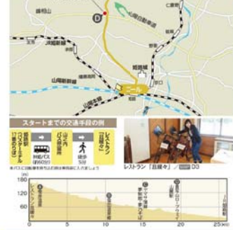
■ 道の駅 住用町ちからふく ■ ① ② ③ ④ ⑤ ⑥ ⑦ ⑧ ⑨ ⑩ ⑪ ⑫ ⑬ ⑭ ⑮ ⑯ ⑰ ⑱ ⑲ ⑳ ㉑ ㉒ ㉓ ㉔ ㉕ ㉖ ㉗ ㉘ ㉙ ㉚ ㉛ ㉜ ㉝ ㉞ ㉟ ㊱ ㊲ ㊳ ㊴ ㊵ ㊶ ㊷ ㊸ ㊹ ㊺ ㊻ ㊼ ㊽ ㊾ ㊿