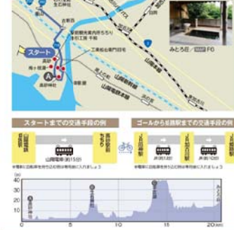
■ 道の駅 住用町ちからふく ■ ① ② ③ ④ ⑤ ⑥ ⑦ ⑧ ⑨ ⑩ ⑪ ⑫ ⑬ ⑭ ⑮ ⑯ ⑰ ⑱ ⑲ ⑳ ㉑ ㉒ ㉓ ㉔ ㉕ ㉖ ㉗ ㉘ ㉙ ㉚ ㉛ ㉜ ㉝ ㉞ ㉟ ㊱ ㊲ ㊳ ㊴ ㊵ ㊶ ㊷ ㊸ ㊹ ㊺ ㊻ ㊼ ㊽ ㊾ ㊿