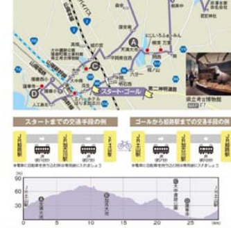
■ 道の駅 住用町ちからふく ■ ① ② ③ ④ ⑤ ⑥ ⑦ ⑧ ⑨ ⑩ ⑪ ⑫ ⑬ ⑭ ⑮ ⑯ ⑰ ⑱ ⑲ ⑳ ㉑ ㉒ ㉓ ㉔ ㉕ ㉖ ㉗ ㉘ ㉙ ㉚ ㉛ ㉜ ㉝ ㉞ ㉟ ㊱ ㊲ ㊳ ㊴ ㊵ ㊶ ㊷ ㊸ ㊹ ㊺ ㊻ ㊼ ㊽ ㊾ ㊿