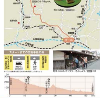
■ 兵庫県加西市北条町駅～小野市栗生駅を結ぶローカル線「北条鉄道」が走るまち ■ ① ② ③ ④ ⑤ ⑥ ⑦ ⑧ ⑨ ⑩ ⑪ ⑫ ⑬ ⑭ ⑮ ⑯ ⑰ ⑱ ⑲ ⑳ ㉑ ㉒ ㉓ ㉔ ㉕ ㉖ ㉗ ㉘ ㉙ ㉚ ㉛ ㉜ ㉝ ㉞ ㉟ ㊱ ㊲ ㊳ ㊴ ㊵ ㊶ ㊷ ㊸ ㊹ ㊺ ㊻ ㊼ ㊽ ㊾ ㊿