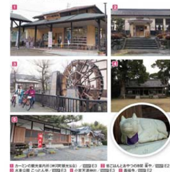
■ カフェの歴史資料館(神戸市歴史協会) ■ ① ② ③ ④ ⑤ ⑥ ⑦ ⑧ ⑨ ⑩ ⑪ ⑫ ⑬ ⑭ ⑮ ⑯ ⑰ ⑱ ⑲ ⑳ ㉑ ㉒ ㉓ ㉔ ㉕ ㉖ ㉗ ㉘ ㉙ ㉚ ㉛ ㉜ ㉝ ㉞ ㉟ ㊱ ㊲ ㊳ ㊴ ㊵ ㊶ ㊷ ㊸ ㊹ ㊺ ㊻ ㊼ ㊽ ㊾ ㊿