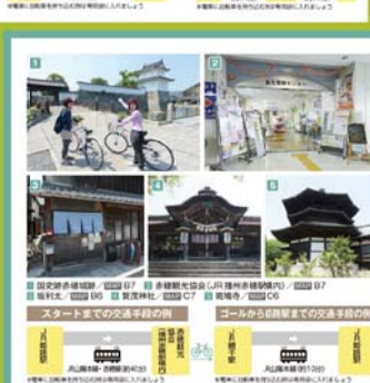
■ 道の駅 相生の白旗 ■ ① ② ③ ④ ⑤ ⑥ ⑦ ⑧ ⑨ ⑩ ⑪ ⑫ ⑬ ⑭ ⑮ ⑯ ⑰ ⑱ ⑲ ⑳ ㉑ ㉒ ㉓ ㉔ ㉕ ㉖ ㉗ ㉘ ㉙ ㉚ ㉛ ㉜ ㉝ ㉞ ㉟ ㊱ ㊲ ㊳ ㊴ ㊵ ㊶ ㊷ ㊸ ㊹ ㊺ ㊻ ㊼ ㊽ ㊾ ㊿