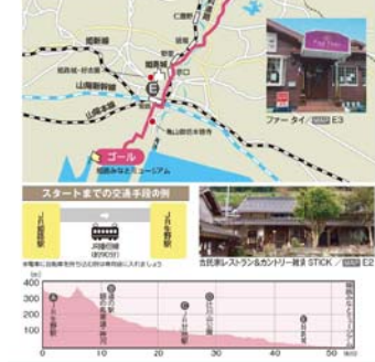
■ 高砂市を出発して、加古川市の田原風土記の中を走るコース、高砂神社で安全な縁結びを祈願してから水に浮かぶ石がある石神社や被褥問屋の「ライバル」として知られる播磨道楽亭の「お宝」や「お宝」など、ご当地グルメ「たこ焼き」や「かつほ」などで、撮影しをなせるフォトジェニックな風景があなたに待っています!