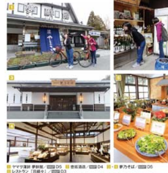
■ ヤマダバイク 夢前店 ■ ① ② ③ ④ ⑤ ⑥ ⑦ ⑧ ⑨ ⑩ ⑪ ⑫ ⑬ ⑭ ⑮ ⑯ ⑰ ⑱ ⑲ ⑳ ㉑ ㉒ ㉓ ㉔ ㉕ ㉖ ㉗ ㉘ ㉙ ㉚ ㉛ ㉜ ㉝ ㉞ ㉟ ㊱ ㊲ ㊳ ㊴ ㊵ ㊶ ㊷ ㊸ ㊹ ㊺ ㊻ ㊼ ㊽ ㊾ ㊿