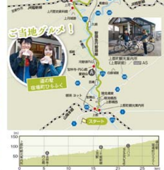
■ 道の駅 住用町ちからふく ■ ① ② ③ ④ ⑤ ⑥ ⑦ ⑧ ⑨ ⑩ ⑪ ⑫ ⑬ ⑭ ⑮ ⑯ ⑰ ⑱ ⑲ ⑳ ㉑ ㉒ ㉓ ㉔ ㉕ ㉖ ㉗ ㉘ ㉙ ㉚ ㉛ ㉜ ㉝ ㉞ ㉟ ㊱ ㊲ ㊳ ㊴ ㊵ ㊶ ㊷ ㊸ ㊹ ㊺ ㊻ ㊼ ㊽ ㊾ ㊿