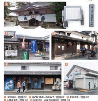
■ 酒蔵博物館 ■ ① ② ③ ④ ⑤ ⑥ ⑦ ⑧ ⑨ ⑩ ⑪ ⑫ ⑬ ⑭ ⑮ ⑯ ⑰ ⑱ ⑲ ⑳ ㉑ ㉒ ㉓ ㉔ ㉕ ㉖ ㉗ ㉘ ㉙ ㉚ ㉛ ㉜ ㉝ ㉞ ㉟ ㊱ ㊲ ㊳ ㊴ ㊵ ㊶ ㊷ ㊸ ㊹ ㊺ ㊻ ㊼ ㊽ ㊾ ㊿