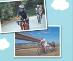
Coraggio Kawanishi Cycling Team チームプロフィール

サイクリングは子供から大人まで気軽に楽しめるスポーツです。風を感じ、景色を楽しみながら自分力だけでこどもでも走ることができ、目的地まで走りきった時の達成感は格別です。 北摂聖山は、厳神間からの優れたアクセス性、田園沿いの平坦路、高低差のある時ど変化に富んだコースが楽しめるサイクリングにとって魅力的な地域の一つです。日本の聖山といわれる黒川や大野山、千手寺などでは四季折々の風景が楽しめる。歴史的建造物、公園などといった魅力的な立寄りスポットも沢山あります。 今回のマップづくりでは、これらのスポットを活かしながら、チームが管段、走行するルート参考に、サイクリングの目標でモデルコースの設定や危険箇所などのアドバイスをしました。また、サイクリングとしてのライディング技術の向上、地域に愛されるサイクリングであるためのマナーや交通ルールといった視点も加えています。 この「北摂聖山-新発見-サイクリングマップ」地域のサイクリング文化の更なる発展に繋がって欲しいと考えています。