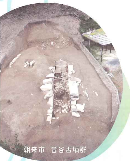
朝来市 音谷古墳群