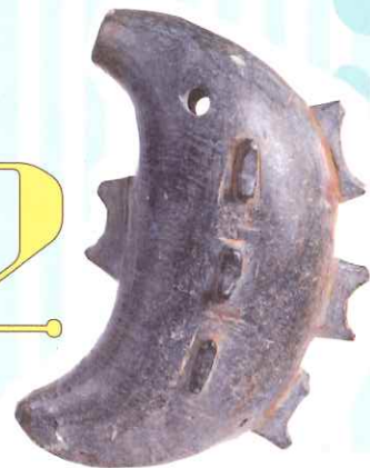
南あわじ市 雨流遺跡