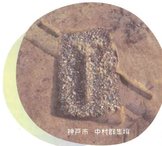
神戸市 中村群集墳