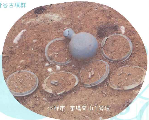
小野市 市場南山1号墳

観覧時間 | 午前9時30分～午後6時(展示室への入場は午後5時30分まで) 休館日 | 月曜日 観覧料 | 大人: 200(150)円 | 大学生: 150(100)円 | 高校生以下無料 ※( )は20名以上の団体料金 ※障害者手帳またはマイロID提示で本人は75%減免、介助者1名まで無料 ※70歳以上の方は大人料金の半額 主 催 | 兵庫県立考古博物館 | 共 催 | 公益財団法人兵庫県まちづくり技術センター