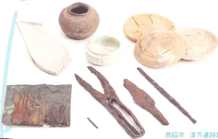
西脇市 津万遺跡群