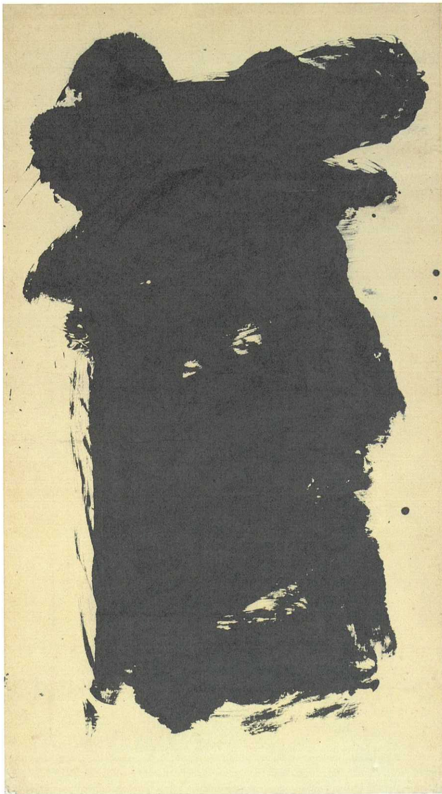
森田子龍(蒼) 1954年、国立国際美術館