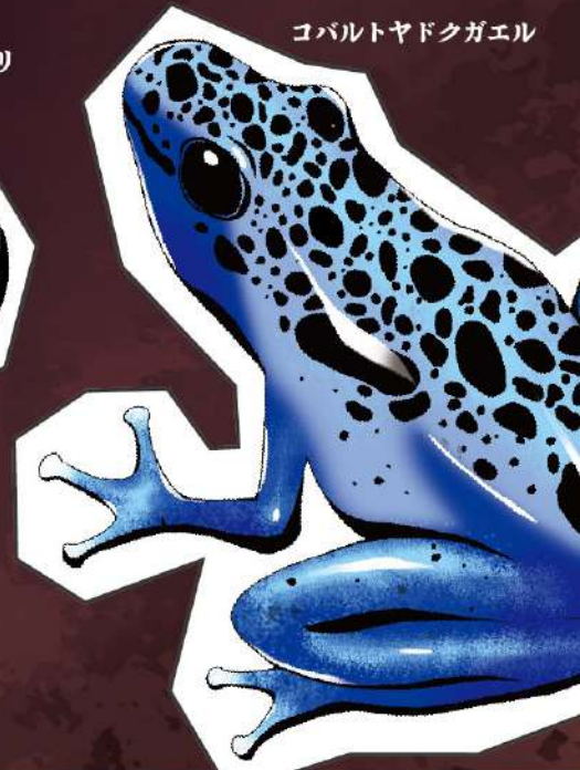
コバルトヤドクガエル