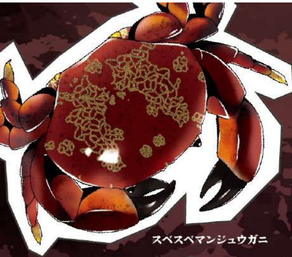
スペースマンジュウガニ