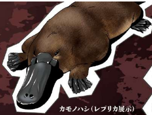
カモノハシ(レプリカ展示)