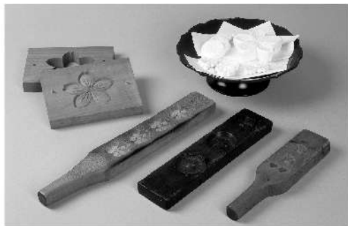
桜花文集子型 (通期展示)