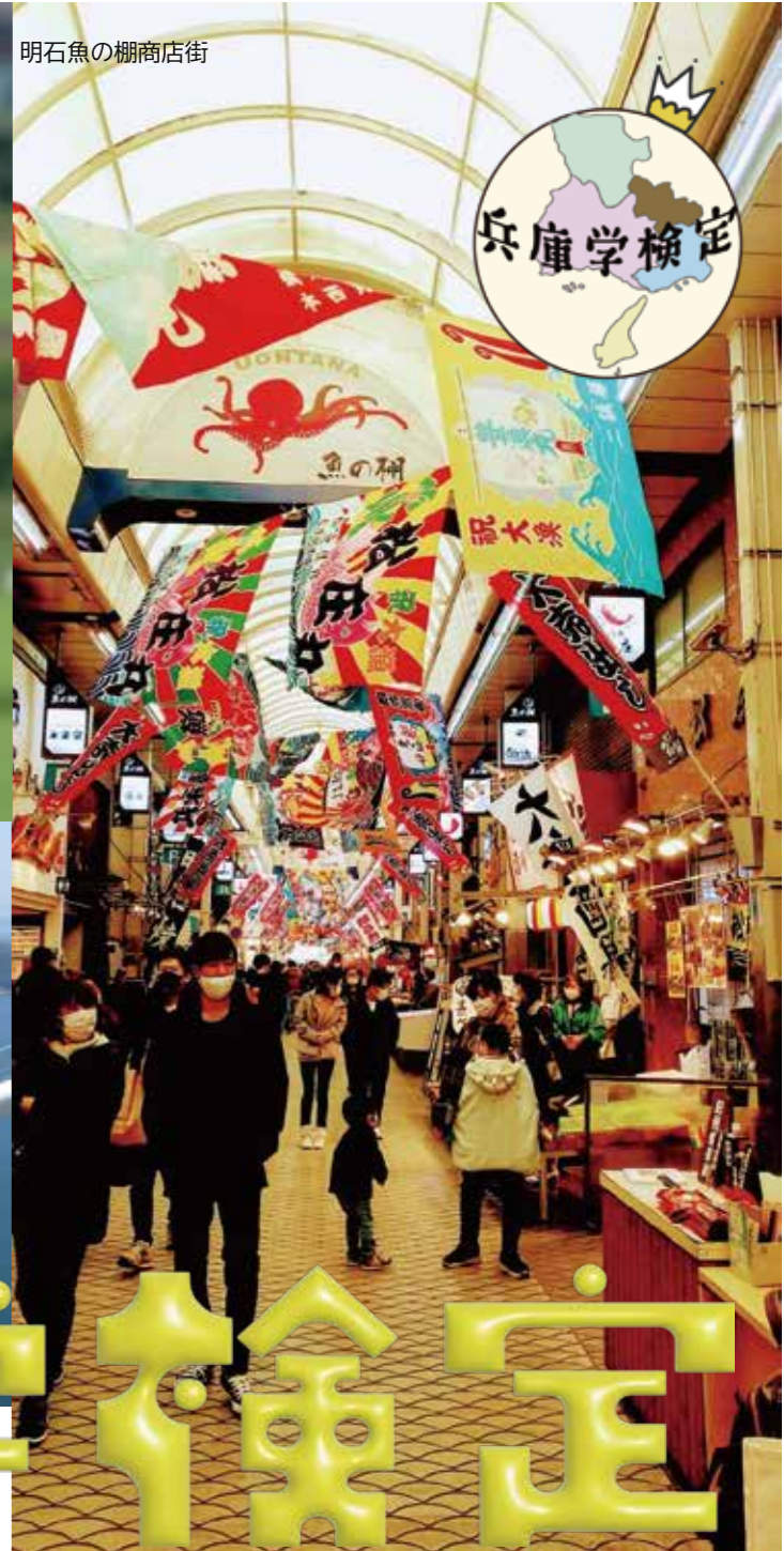
明石魚の棚商店街