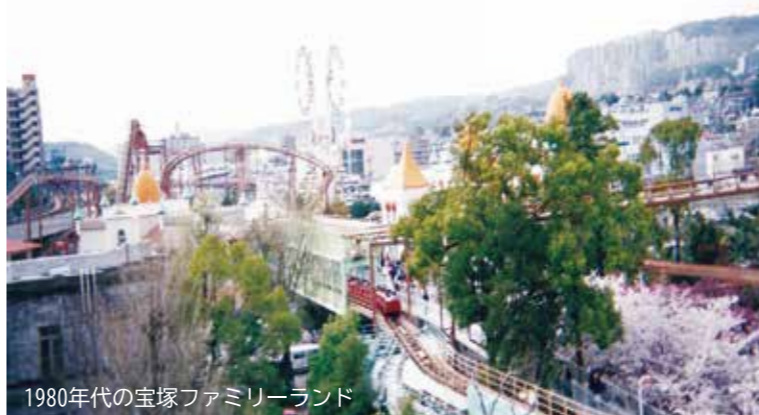
1980年代の宝塚ファミリーランド