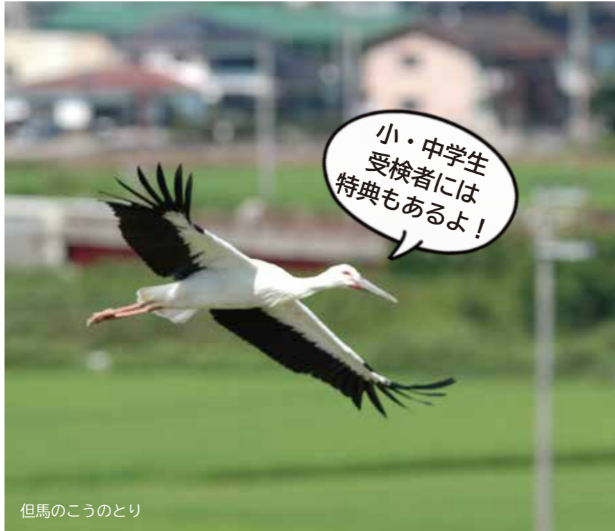
但馬のこうのとりの