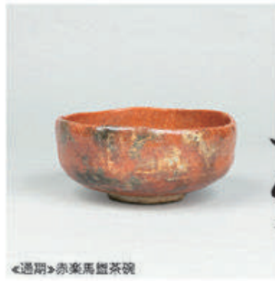
◀通期▶赤楽馬盃茶碗