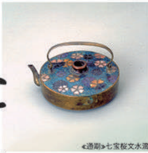
◀通期▶七宝桜文水筒