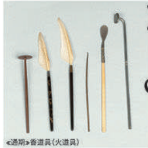
◀通期▶香道具(火道具)