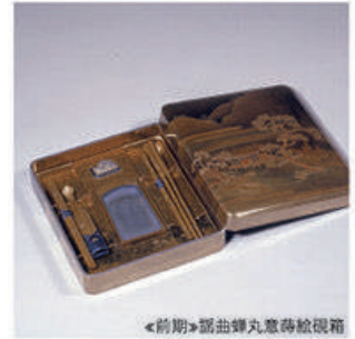
◀前期▶部曲舞丸意香箱