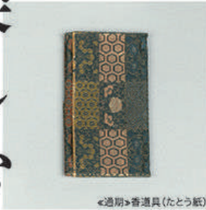
◀通期▶香道具(たとう紙)