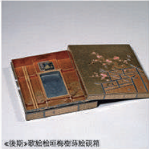
◀後期▶歌絵松垣梅樹香箱

趣 味のお道具には様々な趣向が凝らされ、見る者を惹きつけます。漆工品には蒔絵、金工品には彫金、陶磁器には色絵や染付といった、日本の伝統工芸の技術が、茶道具・香道具・煎茶道具・文房具・刀剣・刀装具にもそれぞれ活かされています。趣味の世界で輝くお道具の魅力を堪能ください。