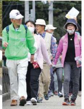
健康ひょうご21県民運動 「健康マイブランチ実践講座」:準備体操