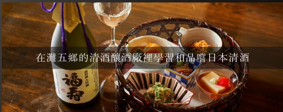
在灘五鄉的清酒釀酒廠裡學習和品嚐日本清酒