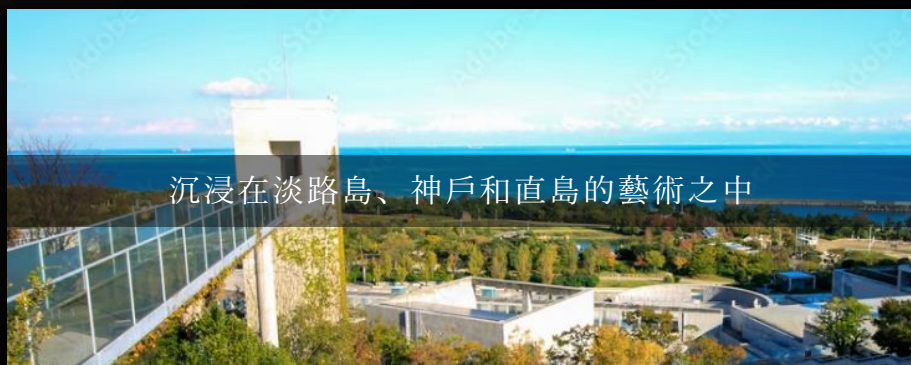
沉浸在淡路島、神戶和直島的藝術之中