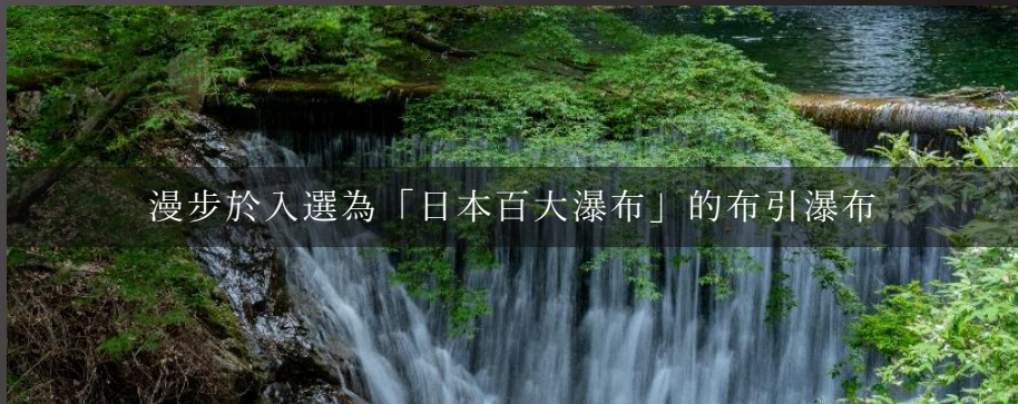
漫步於入選為「日本百大瀑布」的布引瀑布