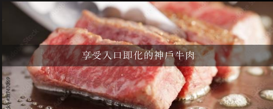
享受入口即化的神戶牛肉