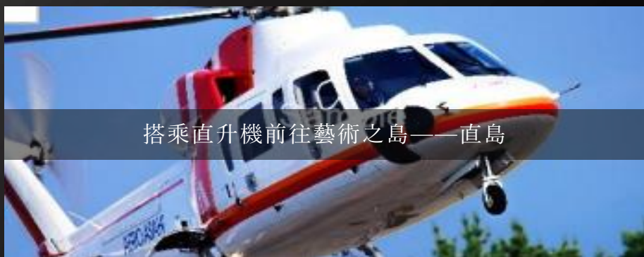
搭乘直升機前往藝術之島——直島