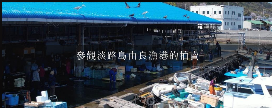
參觀淡路島由良漁港的拍賣