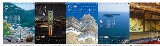
(5 連ポスターイメージ)