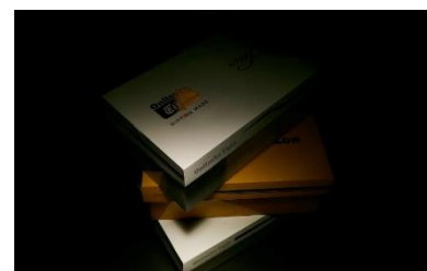
(コラボシューズ ビジュアル)

兵庫DC企画の1つとして、県内企業であるオニツカタイガーとコラボレーションによるシューズを開発・販売し、兵庫DC並びに「兵庫テロワール旅」の認知度向上を図る。