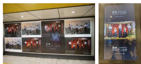
(駅構内プロモイメー)