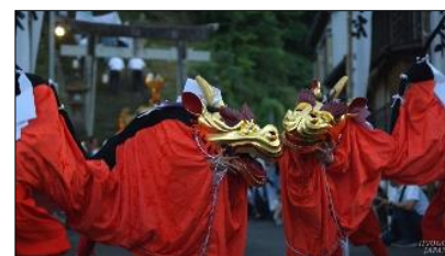
(メインビジュアル動画 夏版)

「兵庫テロワール旅」のコンセプトを伝えるため、全国各地の観光PR動画を手掛けているトップクリエイター永川優樹氏による没入感の強いメインビジュアル動画（通年版）を制作し、広く配信する。