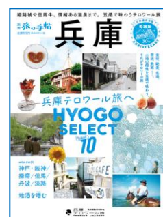
※イメージ