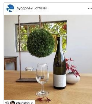
(Instagram「兵庫テロワール lab.」イメージ)